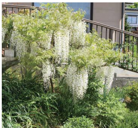
皆さんが丹精こめて管理された花々の一部です

鷹山地区社会体育振興会の総会を白鷹の杜たかやまで4月25日(木)開催しました。 規約の改正 鷹山地区社会体育振興会から鷹山地区スポーツ振興会へ変更しました。 ◎6年度の事業計画 ・グラウンドゴルフ大会 6月9日(日) 元鷹山小グラウンド ・レクリエーション大会 9月8日(日) 元鷹山小グラウンド ・町誕生70周年記念対抗駅伝競走大会 10月13日(日) 白鷹町内 ・ドッチビー大会 11月9日(土) 元鷹山小体育館 ・フラバールバレーボール大会 2月1日か8日(土) 元鷹山小体育館 ◎会費 1戸10000円の協力を願います。 6月中に集金を町内長に依頼致します。