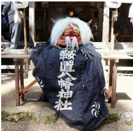
新調された獅子頭、獅子幕

小中学生も獅子舞に参加し、笛を吹き、太鼓をたたき、獅子舞に参加しており、ぜひ伝統を守って欲しいと思います。