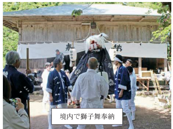
境内で獅子舞奉納