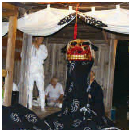
萩野親獅子舞(御入)

8月11日(金) 滝野子ども会育成会で花火を打ち上げました。滝野全体での夏まつりはできませんでしたが若い力の結集にうれしく感じました。 14日(月) 萩野地区庭渡大日堂の祭礼が行われ、4年振りに子獅子舞、親獅子舞が奉納されました。子獅子舞を行うことができなかった3年間のブランクを感じさせない太鼓、笛、踊りに感激です。また、宝くじ助成金で購入した子獅子舞幕の初披露となりました。 15日(日) 中山地区では午後から熊野神社の祭礼で獅子舞が奉納され、夏まつり(若い人達による縁日の出店、ジューケー ウォークのミニコンサート、花火打ち上げ)が行われ、特に例年通り素晴らしい花火の打ち上げとなりました。