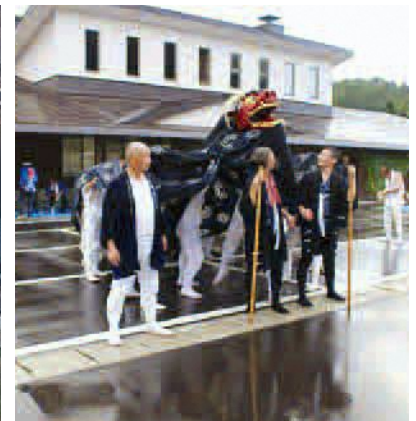
萩野親獅子舞(白鷹の杜たかやま前)