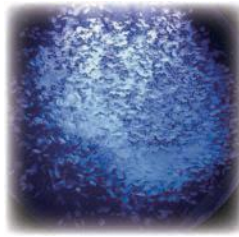
クラゲドリームシアター 加茂水族館

梅雨にもかかわらず晴天に恵まれことぶき旅行に行くことが叶いました。鶴岡の加茂水族館で神秘的なクラゲの生態を知り、酒田では美味しい刺身・フライ御膳を堪能しました。おしんの口ケ地山居倉庫でお土産を買って、東北銘醸造蔵探訪館で初孫の夏酒を試飲しました。ことぶきのみなさんの楽しい外出の機会をこれからも提供していきたいと思っておりますのでぜひご参加下さい。