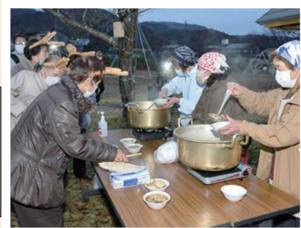
健康づくり推進員のみなさん 会場で芋煮をふるまい