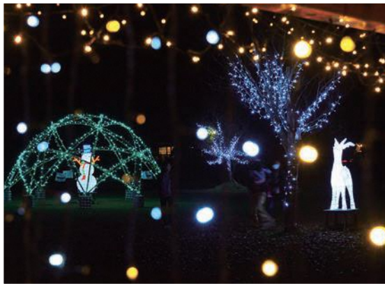
病院前の広場は 夢の世界 点灯時間 16:50~22:00

夕方16時、健康づくり推進員のみなさんと仲町壮年部の手作り芋煮が点灯式の会場であつた。点灯式には入魂の儀式があり、それが点灯のファンファーレなのだが、なんと今年は荒砥高校オービーズで実現。上山から駆けつけて下さった本田先生に感謝です！ たくさんの方が関わることにより、たくさんの方を癒やし、たくさんの方に愛されるイルミネーションになるといいですね。 点灯は来年の2月末まで。ご家族で訪れてみてくださいね。