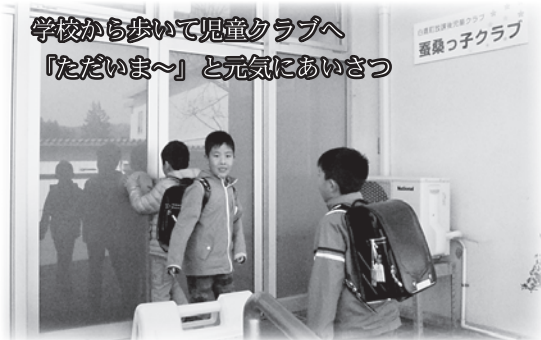
学校から歩いて児童クラブへ 「ただいま〜」と元気にあいさつ