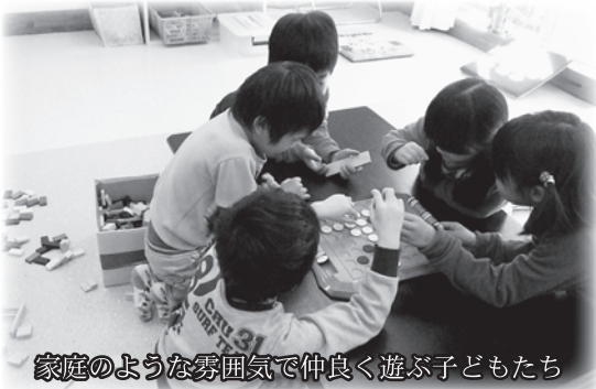
家庭のような雰囲気の中で仲良く遊ぶ子どもたち