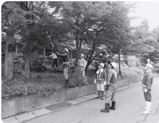
安全に作業していただき、ありがとうございました