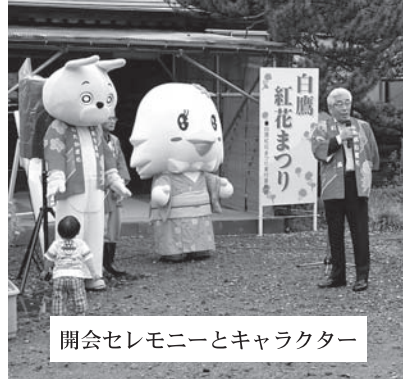
開会セレモニーとキャラクター