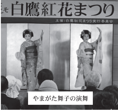
やまがた舞子の演舞