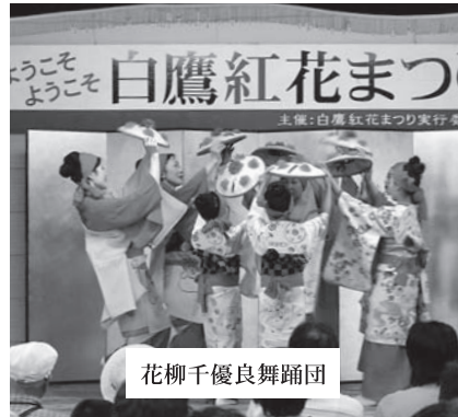
花柳千優良舞踊団