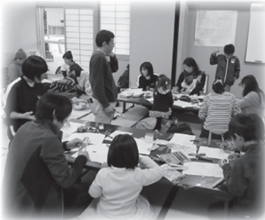
↑プラパン作りは地域おこし協力隊と白鷹中学生もお手伝い。 ↓おばけかぼちゃは60キロでピタリ賞二人でした。

また、今年の目玉として総務部会担当の「地区対抗鍋台戦」が行われました。これは、町からの地域づくり交付金特別枠を使って行ったもので、10円で割りばしを買って5つの鍋が味わえるようになって約260名の方に参加いただきました。(結果は2ページに記載)準備から片付けまで3日間お手伝いいただいた専門部会員の皆さん、山口地区の分館長・書記の皆さんに感謝申し上げます。