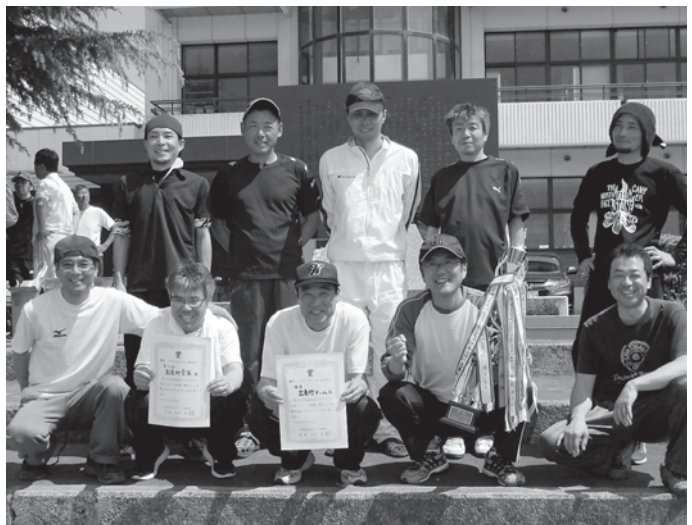
優勝！ 出来町チームの皆さん