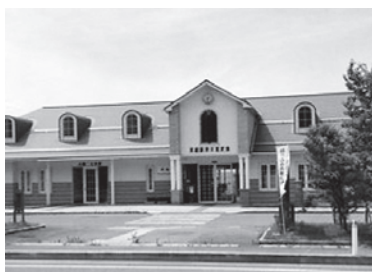
荒砥駅に併設する八幡二分館

ところ・・・戸数が少ないがゆえに、何かあった時に助け合える、声をかけあえる、この関係が一番のよいところかもしれません。