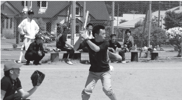
声援にこたえてホームラン！

当日は晴天に恵まれ選手たちは掛け声をかけながら楽しくプレーを繰り広げ、大会運営もスムーズに行われました。ご協力いただいた役員の皆様、暑い中たいへんお疲れ様でした。