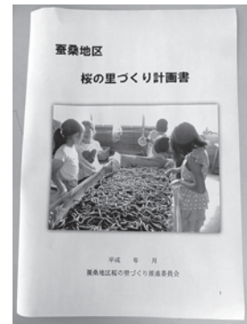
でき上がった計画書