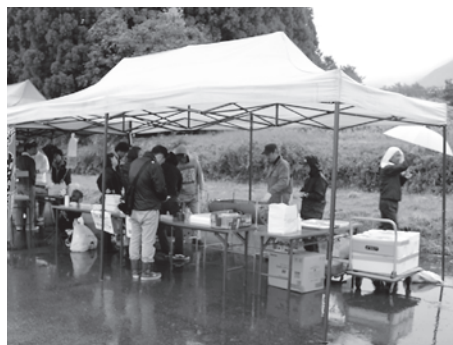
滝野若い衆会売店