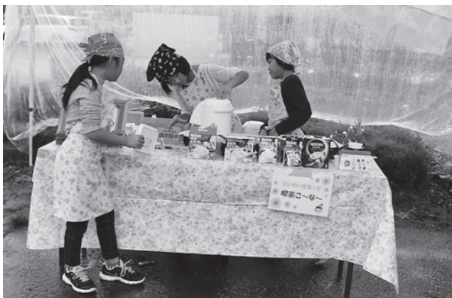
わいわい元気っ子クラブ売店 (湯茶接待コーナー、チョコバナナコーナー)