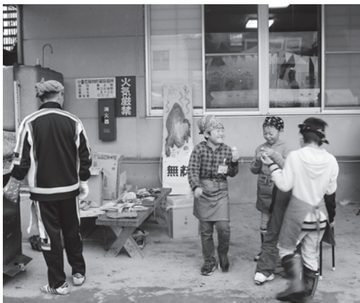
焼きいもプレゼント

萩野地区御庭渡神社の親獅子舞と子獅子舞を演舞していただく予定でしたが雨が降り止まず中止にさせていただきました。