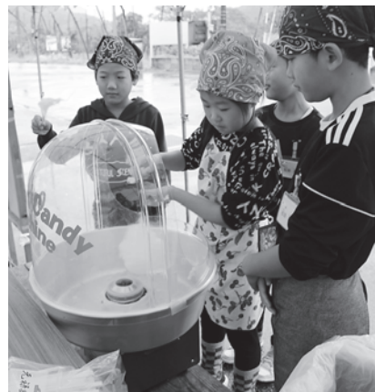
綿あめづくり体験