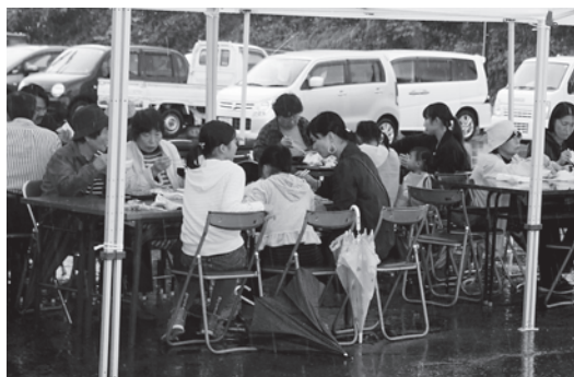
雨の中ありがとうございます ちょっと休憩