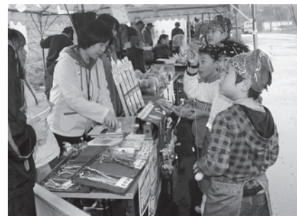
しらたかFACTORI 作品販売