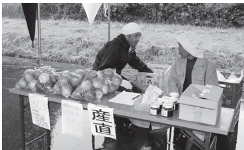
りんご、はちみつの直売