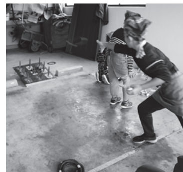
輪投げで賞品ゲット