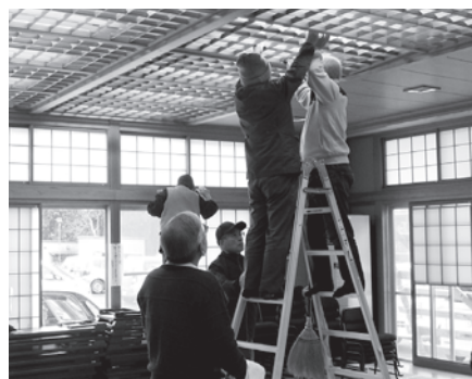
天井の電球も明るくなりました