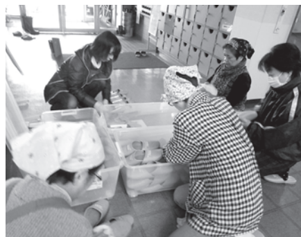
毎日使うスリッパもすっきり