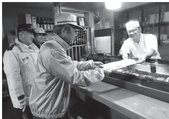
おだがいいきーつけっぺな〜

12月6日、交通対策協議会、交通安全母の会、交通安全協会、白鷹東駐在所の共催で、飲酒運転撲滅キャンペーンで荒砥町内を巡回しました。年末年始は、特に飲酒する機会が増えますが、酒類提供者にも厳しい罰則があります。「ビール一杯だから問題ない」「お酒に強いからこれくらいは大丈夫」と安易な気持ちで運転したことにより、事故を引き起こすケースが多くなっています。飲酒運転は重大な犯罪です。この日は、夕方から、白鷹東駐在所に集合し、打ち合わせをしてから、お互いにルールを守って、飲酒運転による事故の撲滅を図ってほしいと荒砥町内の各店舗にチラシを配り、協力を呼びかけました。