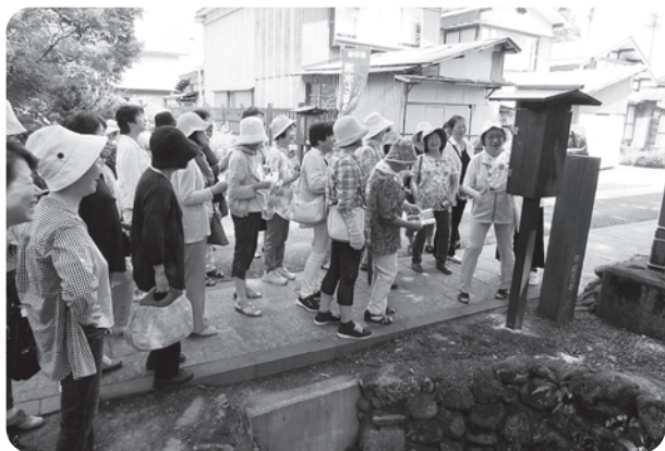
ボランティアガイドさんの説明を楽しく聞く学級生のみなさん

また、秋田ふるさと村では、秋田杉を使った「まげわっぱづくり」と「箸の研ぎ出し」を体験し、秋田ならではの思い出をたくさん作ってこられたようです。