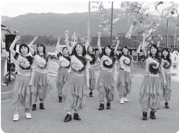
結成3年目のマルベリーズの息の合ったダンス 8月5日のこぶしの家夏まつりでも観れますよ。

四季の郷駅開業10周年記念事業を開催 大勢の方々のご協力で 七夕飾りまつりと 記念花火大会は大盛況