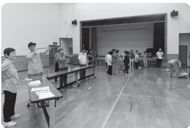
輪投げと吹き矢を楽しむ学級生のみなさん

スポーツ教室ではあいにくの天候の為、グラウンドゴルフはできなく、ハーモニープラザで輪投げとスポーツ吹き矢を行いました。スポーツ吹き矢は初めてされる方が多く、最初は届かない方もいらつしやいましたが、何回か挑戦するうちに届くよう