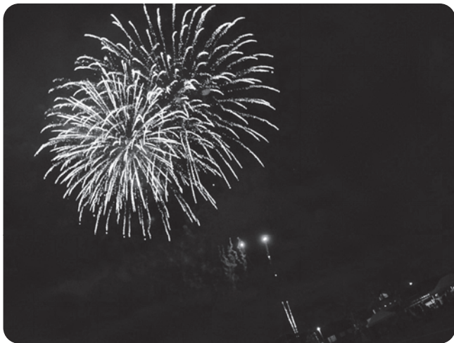
多くの方々のご支援で打ち上げることができた花火は、ひときわきれいに見えました。

尚、残金分は11月26日のイルミネーションの点灯式で打ち上げさせていただきますのでよろしくお願い致します。