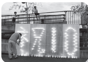
←記念キャンドルの下に並べました

今回はクレヨンで色を付けたカラフルなキャンドルと紙コップで作ったものの2種類を作りました。紙コップのものは、7月1日に開催された「四季の郷夏感謝祭・七夕飾りまつりと記念花火大会」での記念キャンドル点灯に使用し、会場を彩っていただきました。