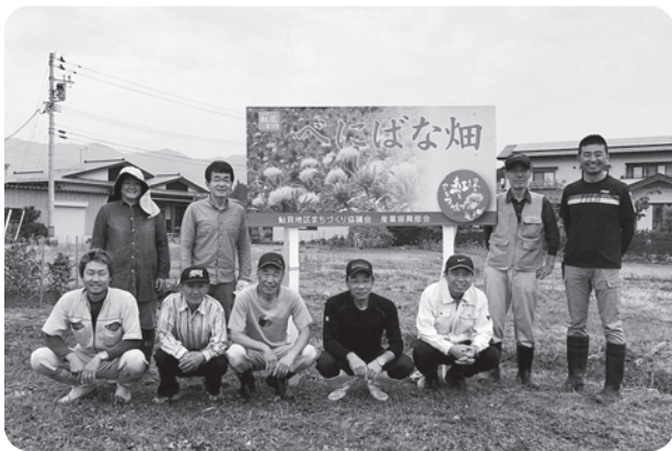
看板の設置作業を終えた 産業振興部会員のみなさん

4月に雨と低温が続く、例年よりも遅い4月下旬に播種作業を行い、その後間引き除草作業、支柱立て作業などを行いました。残念ながら紅花まつり期間内での開花は間に合いませんでしたが、今月下旬まで楽しめます。