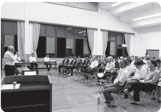
地区代表あいさつをされる 宮城区長会長