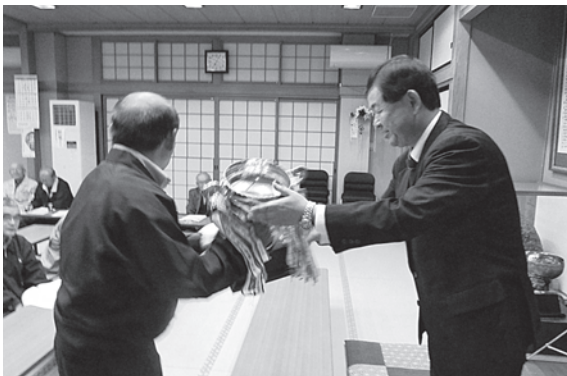
年間総合優勝の仲町チームへ優勝カップを授与

年間地区別総合優勝の表彰状は、仲町区に授与されました。今年度も、地域の皆様のご協力をよろしくお願い申し上げます。