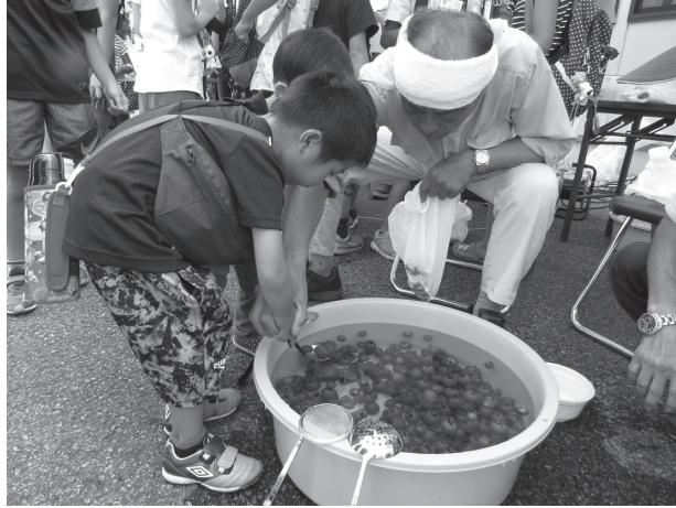
ミニトマトすくい 何個すくえたかな