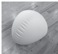
フラバールのボール