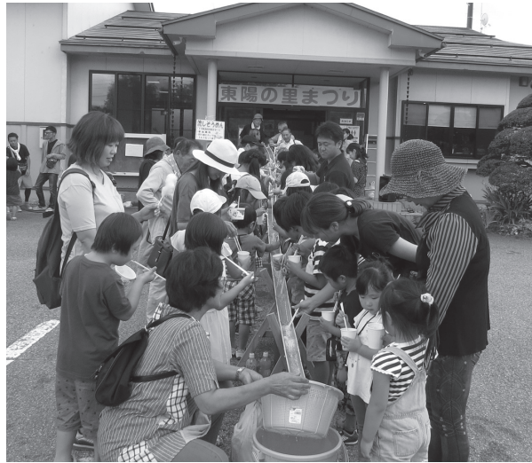
恒例の流しそうめん