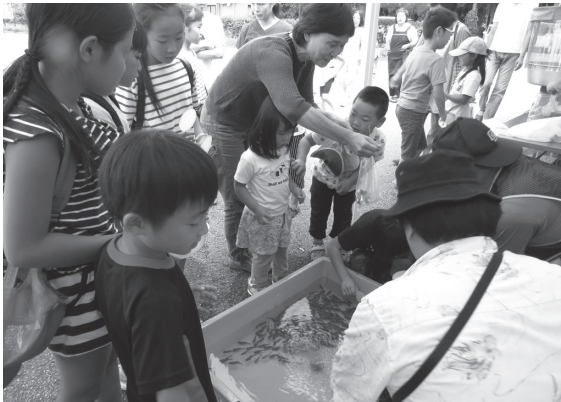
大人気 金魚すくい

絵付け等を行い子ども達に大人気でした。 まつり会場全体でみんなが笑顔になって、楽しい時間を過ごしました。 ご参加いただきました皆様ありがとうございました。