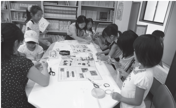
作って楽しい！ヘアゴムアレンジ