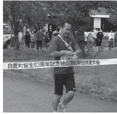
↑昨年度の駅伝大会 ゴールの様子

9月9日(日)東根小学校大運動会で各学年男女別徒競走で1位になった児童のみなさんへ、昨年度に引き続き、体育振興会より、記念メダルを贈りました。