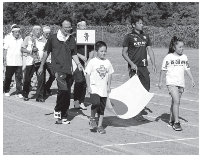
国旗、前年度優勝青チームを先頭に入場行進