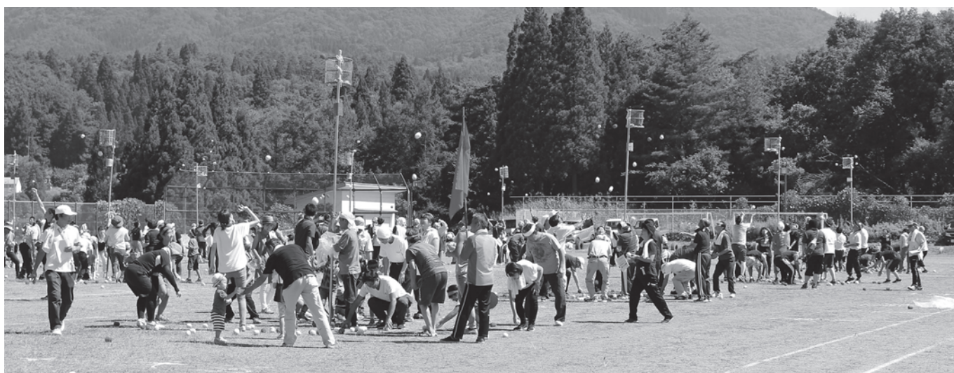
15個のかごにまり入れ グラウンドが狭く感じられます