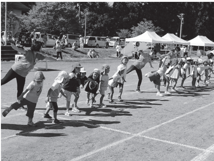
よつば子ども園 園児の遊戯