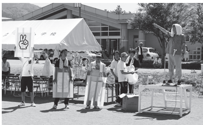
じゃんけん大会 賞品ゲット