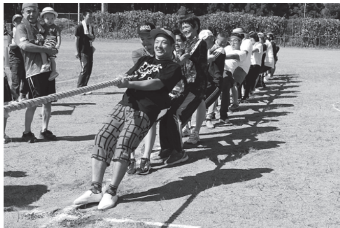
綱引き競争 余裕です 圧倒的強さ 優勝の赤チーム