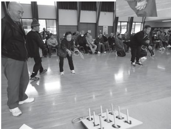
↓ 競技中の様子(親和会さん)

2月14日(金) 個人戦80名、団体戦15チームが参加し、シニアワナゲ大会を開催いたしました。大会結果は次ページに掲載している通りです。今まで練習した成果を発揮するべく、仲間の応援を力にして、真剣に競技に取り組んでいました。練習場所とは違うせいも、いつもより得点を出せない方が多かった中で、個人戦では1名の方がパーフェクト賞を達成され、一際大きな歓声が上がっていました。 団体戦では惜しくもパーフェクトは出なかったものの、和やかな雰囲気の中で参加者の方々は競技を楽しんでいました。