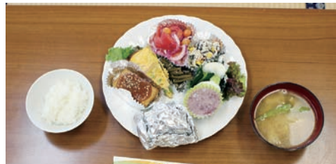
ワンプレートの料理