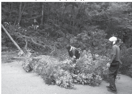
↑ 7/23 杉沢区