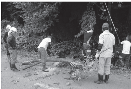
↑ 8/2 小山沢区

今年度は新型コロナウイルス感染拡大防止の観点から、7月の危険箇所点検も各区での実施となり、そちらの結果を受けて、7月23日(木)に杉沢区、7月26日(日)に浅立区、8月2日(日)に広野区、小山沢区、町下区の樹木伐採がそれぞれ行われました。毎年使用していました高所作業車も、今年度は感染拡大防止や作業時間短縮の為、使用しないこととしました。