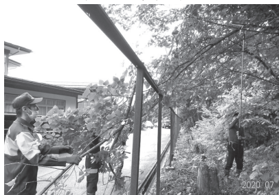
↓ 7/26 浅立区