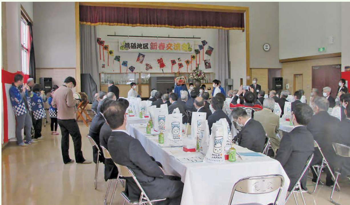
つかの間の穏やかな時期に行われた新春交流会